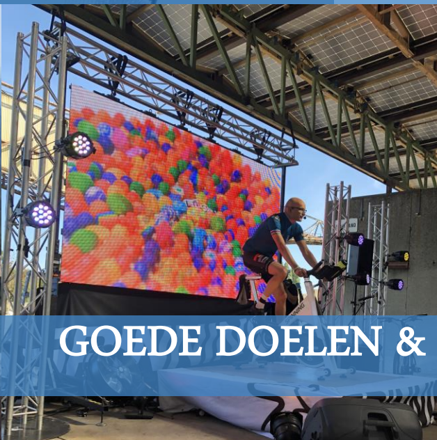
GOEDE DOELEN & MVO